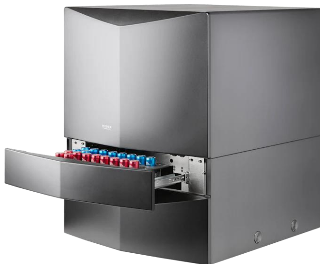
Obr. 1 Zariadenie Hidex 300 SL